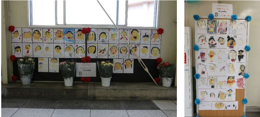
展示イメージ(昨年の様子)