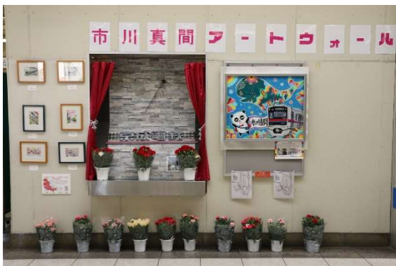
展示イメージ(昨年の様子)

3. 公益財団法人 日本対がん協会様との乳がん啓発活動募金BOXの設置、リーフレットの配布等