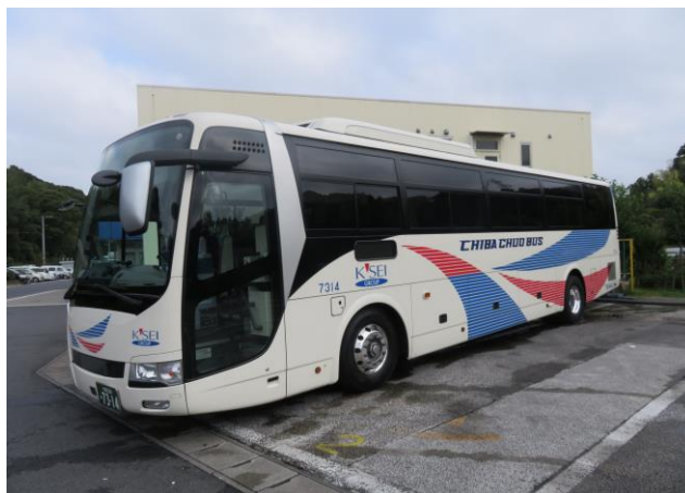
当社が運行する高速バス車両（一例）