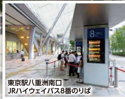
東京駅八重洲南口 JRハイウェイバス8番のりば