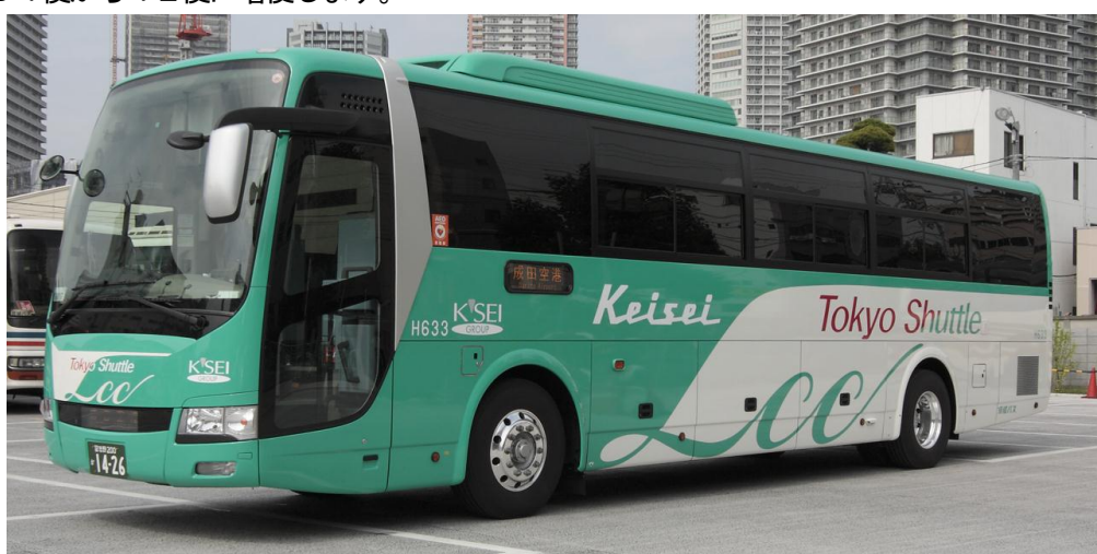
『東京シャトル (Tokyo Shuttle)』の運行車両