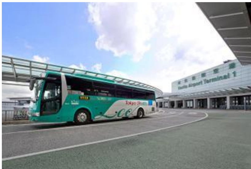
『東京シャトル (Tokyo Shuttle)』の運行車両

「粋割」とは、東京都心（東京駅・東雲車庫・銀座駅・大江戸温泉物語）から成田空港「行き」にご乗車いただくお客様に『東京シャトル (Tokyo Shuttle)』を今まで以上にご利用いただきやすいものとするために実施するものです。