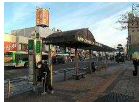
京成バス 一之江駅バス停（葛西向け） 【のりば番号5】 【のりば番号7】に御廻りください。