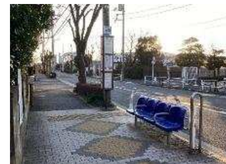
京成バス 明和橋バス停（葛西向け） 春江町3丁目バス停に御廻りください。