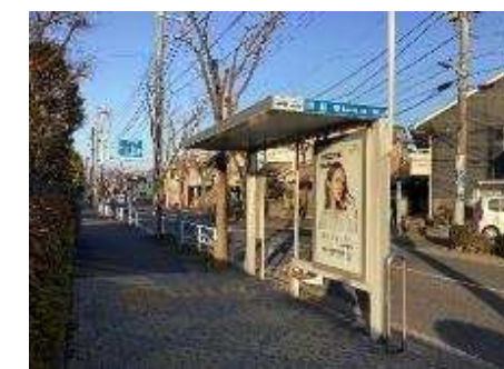
京成バス 明和橋バス停（小岩向け） 春江町3丁目バス停に御廻りください。

バス運行に関する問い合わせ：京成バス株式会社 江戸川営業所 03-3677-5461 工事に関する問い合わせ：東京都江東治水事務所 高潮工事課 工事担当 03-3692-4518 京浜建設株式会社 新中川10作業所 080-3930-4802（つだ）