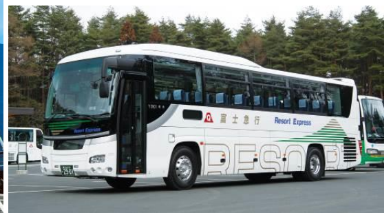
運行車両(上:京成バス 下:富士急行観光)

これは、夏季の行楽シーズンを迎え、国内外からの需要が高まりつつある「富士山・河口湖」方面への高速バスについて、更なる利便性向上と利用促進を図るため、路線の再編を行うものです。