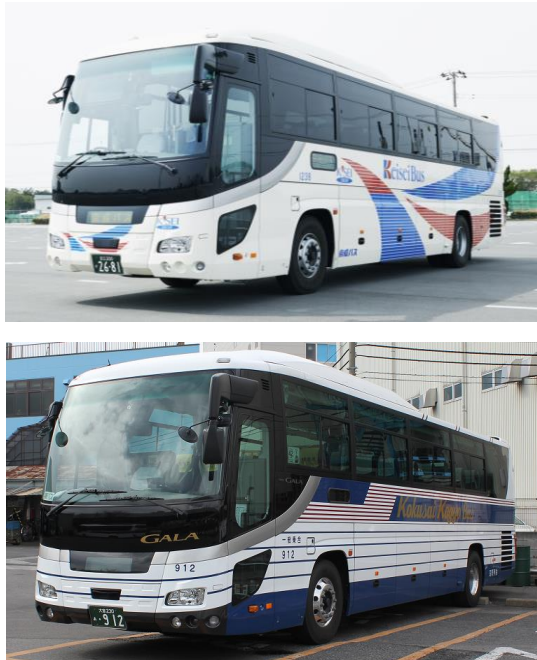
運行車両（上：京成バス 下：国際興業）

この路線は、東京北部や埼玉方面への一大ターミナルである池袋駅と「東京ディズニーリゾート®」を結ぶ新路線です。「池袋駅」から「東京ディズニーリゾート®」までを乗り換えなし（最短45分）で結ぶことで、鉄道各線の沿線にお住まいの方や増加する訪日外国人の方々のアクセスが飛躍的に向上します。（一部の便は「武蔵浦和駅」が起終点となります）。